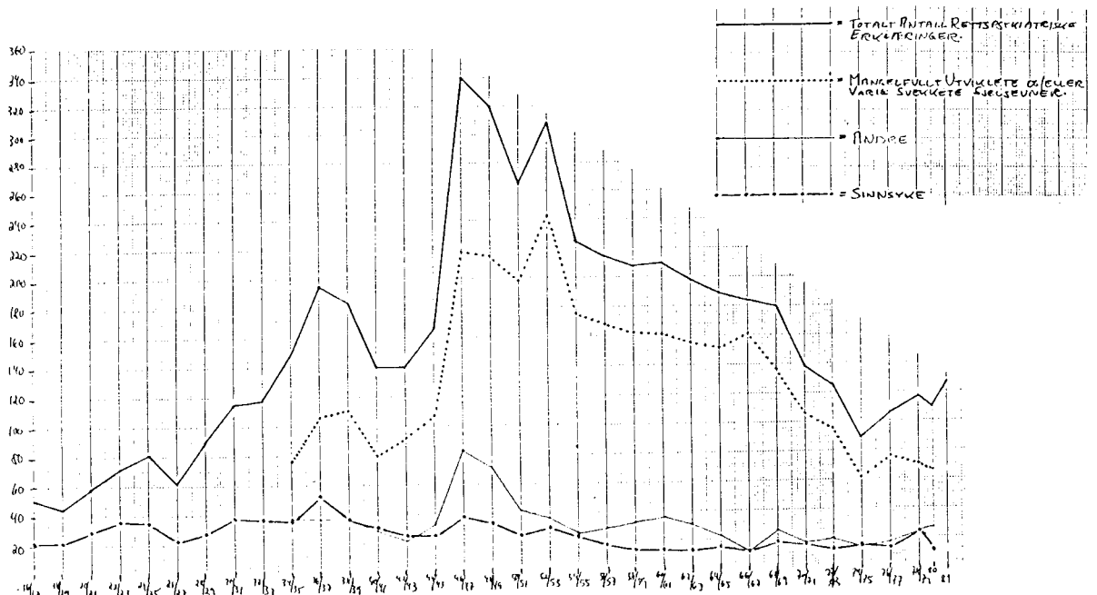
Figur 2.7.-1: Judisielle observasjoner samt fordeling på "mangelfullt utviklete og/eller varig svekkete sjelsevner", på "sinnsykdrom" og på "andre". 1916/17-1980/81, gjennomsnitt for to-årsperioder. Absolutte tall.

Legene spiller som tidligere nevnt en sentral rolle. Noe om dere virksomhet kan vi lese i beretningene som Den rettsmedisinske kommisjon (RMK) gir ut år om annet. (Etter 1979 er det ikke kommet nye beretninger, pr. april 1986.) Her finner vi bl.a. oversikter over antallet judisielle observasjoner, samt fordelingen av de viktigste rettspsykiatriske diagnosene.