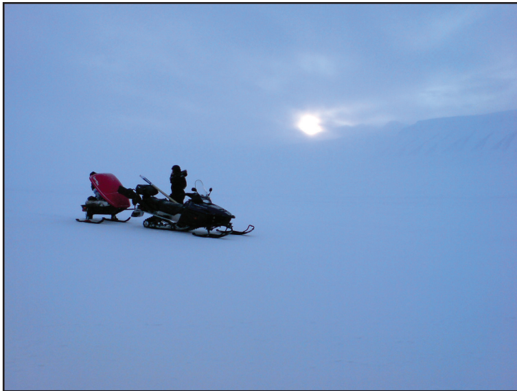
Den ensomme scooterfører i «ett med» naturen. Tilfeldig person ved snøscooteren med slede og kasse bak.

samtidig som de var glad for at turistenes ferdsel begrenses mer enn de fastboendes. Jeg vil i dette kapittelet bruke disse modellene for å belyse ulike holdninger til og bruk av snøscooteren i landskapet rundt Longyearbyen.