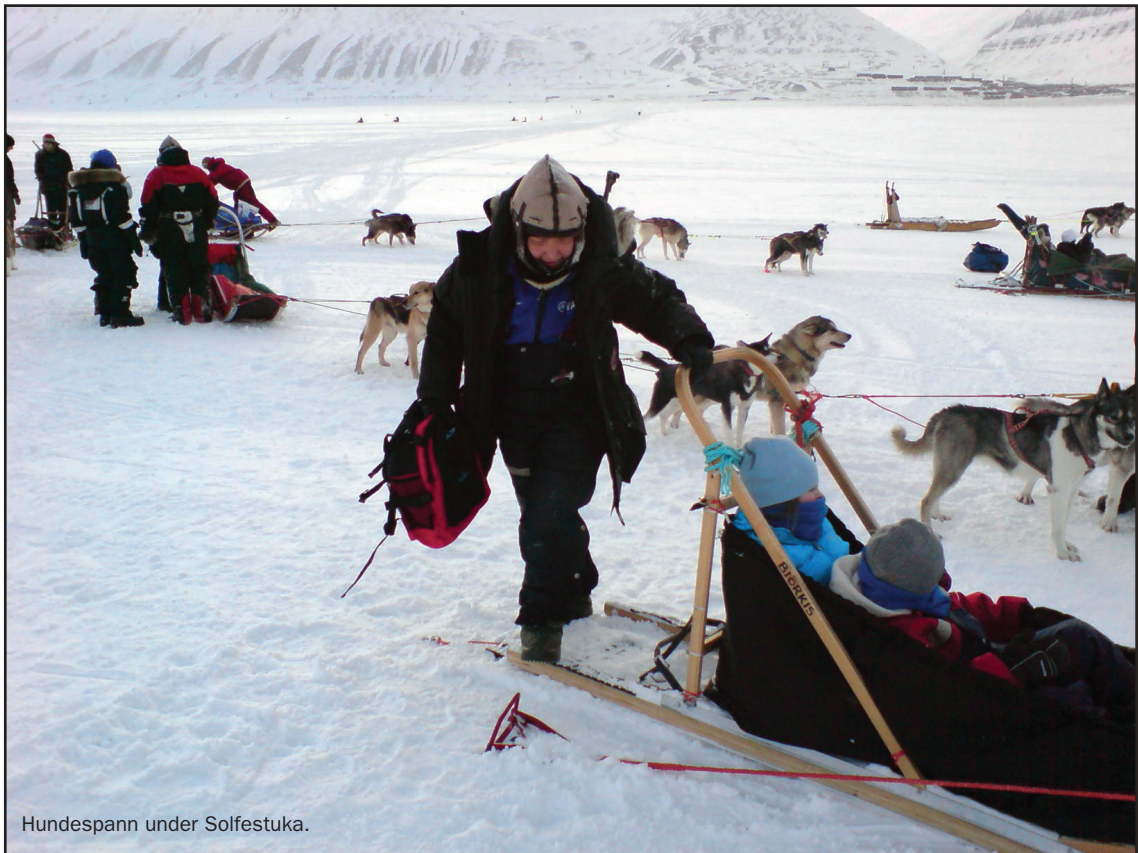
Hundespann under Solfestuka.