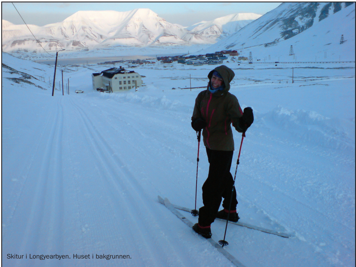
Skitur i Longyearbyen. Huset i bakgrunnen.