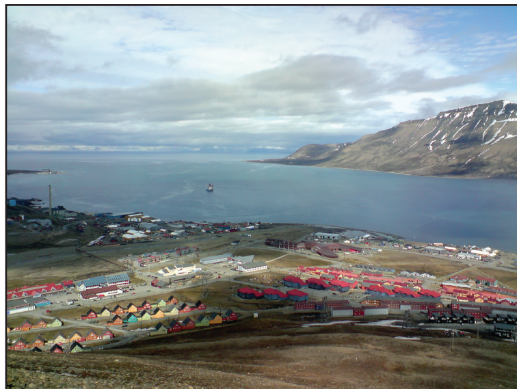
Oversikt over sentrum i Longyearbyen med Adventfjorden og Hiorthfjell i bakgrunnen