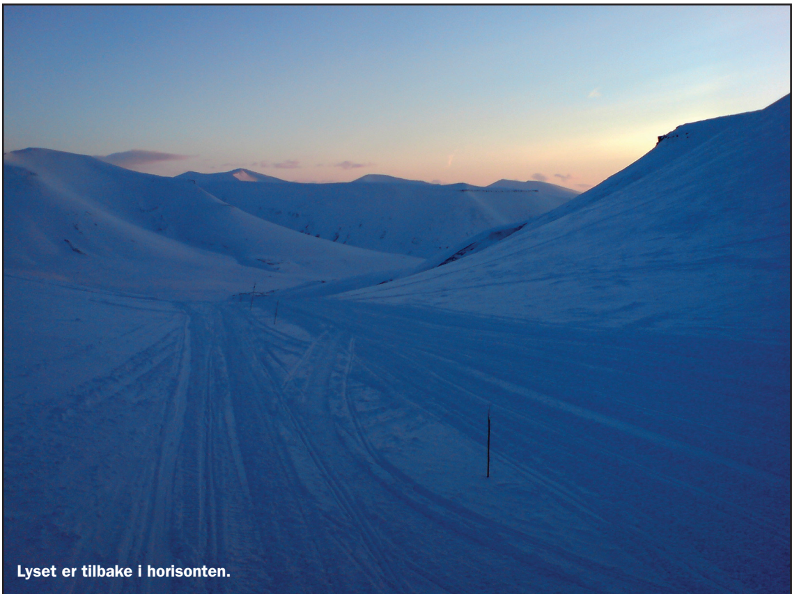
Lyset er tilbake i horisonten.