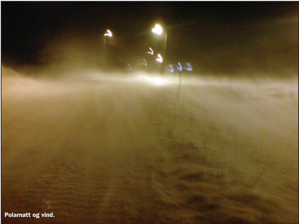
Polarnatt og vind.