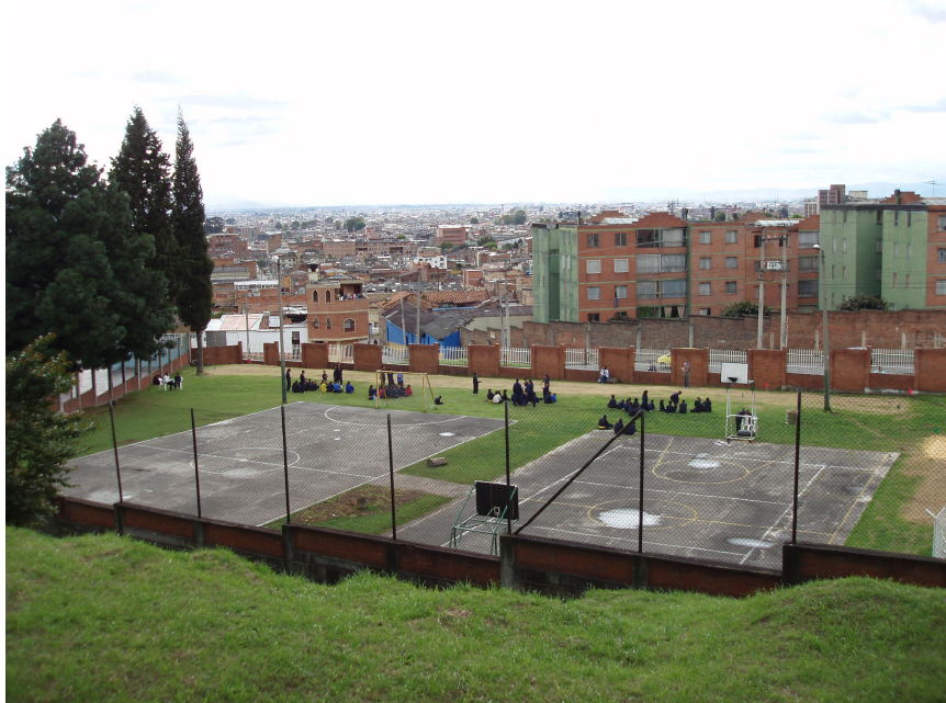
Grønn sone, med utsikt over den sørlige delen av Bogotá, mai 2006.