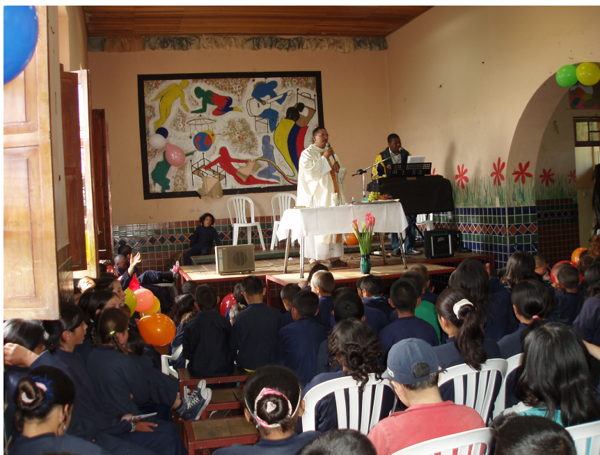
Under feiringen av Familiens Dag, 31. mai 2006.