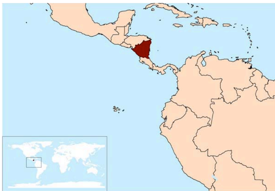
Figur 1: Kart som viser Nicaraguas beliggenhet.

naturmiljøet førte med seg, og å tilpasse seg den nye situasjonen fattige småbønder befant seg i, som et resultat av store endringer over et kort tidsrom.