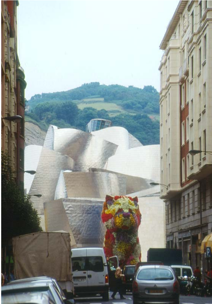
Figur 4 Guggenheim Bilbao, - et mye brukt eksempel