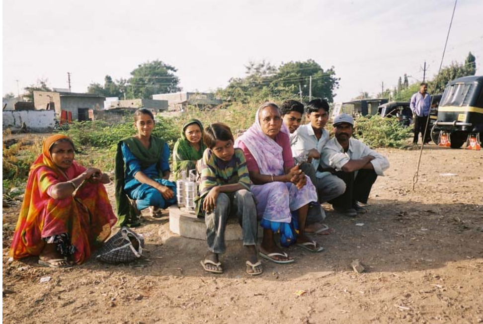
Bilde 1: Arbeidere på Dipak Chowk