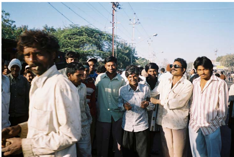
Bilde 3: Arbeidere på Gadechi Vadla

Jeg observerte at det kommer flest menn til dette morgenmarkedet og noen kvinner, men ingen barn. Også til Gadechi Vadla kommer mange av mennene på sykkel og syklene står parkert ved siden av hverandre i veikanten. Antallet arbeidere som kommer hit kan være rundt 200 på det meste. Ifølge en kvinnelig arbeider fra Gadechi Vadla jobber ikke kvinnelige arbeidere fra dette morgenmarkedet under kvinnelige mukadamer, fordi de gjør en annen type arbeid. Hun sa at arbeiderne fra Gadechi Vadla for det meste hyres til små byggeprosjekter, ofte i lavinntektsområdet Kumbharwada. I uformelle samtaler på Gadechi Vadla og under intervjuer ble jeg fortalt at mange av arbeiderne som bor i byen er bosatt i Kumbharwada og rundt industriområdet Chitra Industrial Estate i nærheten, men at det også kommer arbeidere fra landsbyene som ligger på denne siden av byen til dette morgenmarkedet.