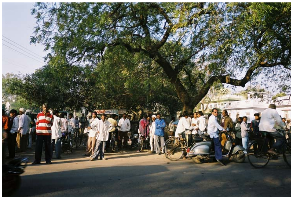
Bilde 2: Arbeidere på Limbdiyu

Jeg observerte også at folk fra landsbyene kommer til morgenmarkedet i grupper med lastebiler og at flere av mennene er kledd i tradisjonelle klær, noe som er vanlig blant befolkningen på landsbygda. Arbeidere, både de fra landsbygda og de som bor i byen, sykler, og mange sykler står parkert under trærne. Noen arbeidere har redskaper festet til sykkelen.