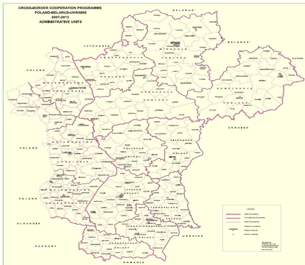
Figur 3. Grensekryssende samarbeid mellom Polen og Ukraina. http://ec.europa.eu/europeaid/where/neighbourhood/regional-cooperation/enpi-cross-border/documents/poland-belarus-ukraine_adopted_programme_en.pdf

Det totale geografiske området kvalifisert for støtte strekker seg over 316.000 km 2 med tilgrensede landområder i de tre landene, og omfatter hele den 535 km lange grensen mellom Polen og Ukraina.