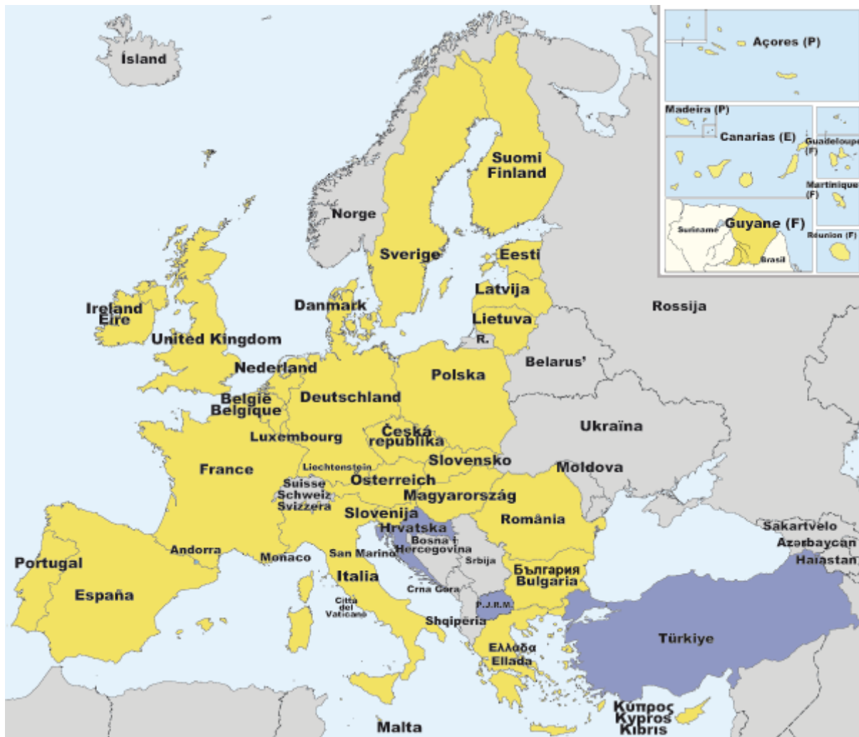
Figur 2: Kart over EUs medlemsland. Her markert i gult.

delen av det tidligere jernteppet. Utvidelsen av Schengen-avtalen til åtte av disse landene tok bevegelsesfriheten til et helt nytt nivå, og sørget for ”grenseløse” muligheter for å reise innenfor stort sett hele EU. Men denne utviklingen, som for enkelte representerte den endelige fjerningen av jernteppet, hadde konsekvenser på Unionens østgrense. Byggingen av et forent Europa med fri flyt av varer, tjenester, mennesker, og kapital, krevde at EU også måtte ha sikre og tette grenser et sted. Per i dag strekker denne grensen seg fra den finsk-russiske grensen i nord, til hvor Hellas møter Tyrkia og Albania i sør. En spesielt lang (ca. 320km) og travel seksjon av EUs nye grense går (mer eller mindre) langs elven Bug og inn i Vest-Karpatene, og deler Polen og Ukraina (Szmagalska-Follis 2009). Filosofien som styrer EUs indre anliggende er at grenseløst rom kun er mulig innenfor klart definerte grenser, og O’Dowd (2002) registrerer at nedbygging av de interne grensene fordrer en styrking av de eksterne grensenes barrierefunksjon.