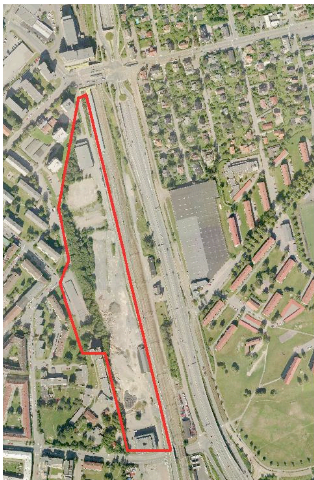
Bilde 1: Utbyggingsområdet for Grefsen stasjonsby

Grefsen stasjonsby, eller Grefsen stasjon som utbyggingsprosjektet ble omdøpt til i forkant av den planlagte salgsstarten våren 2010, omfatter et langt og smalt område i bydel Sagene som ligger mellom Storo bro i nord og Sinsen i sør. I øst avgrenses området som skal bebygges av sporområdene for både tog og t-bane, Ring 3 og bydel Nordre Aker. I vest grenser det mot den eksisterende bebyggelsen i bydel Sagene.