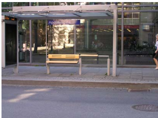
Bussholdeplass i Akersgata.