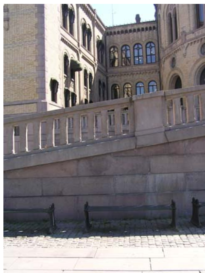
Benker foran Stortinget