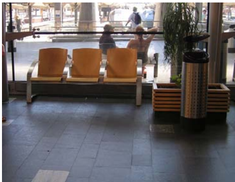
Venteområdet på Oslo sentralbanestasjon 18 .