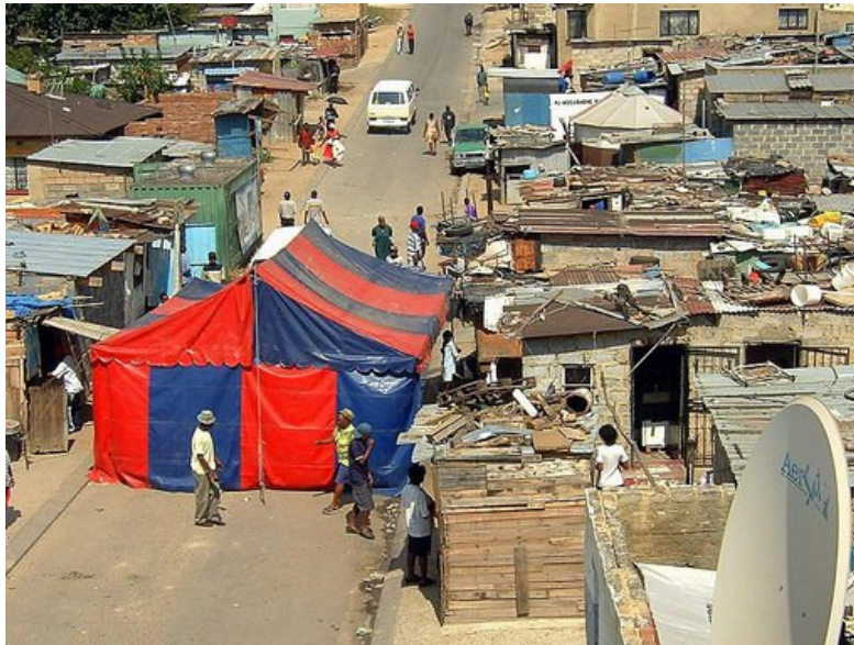
(Tilfeldig township i Sør-Afrika)