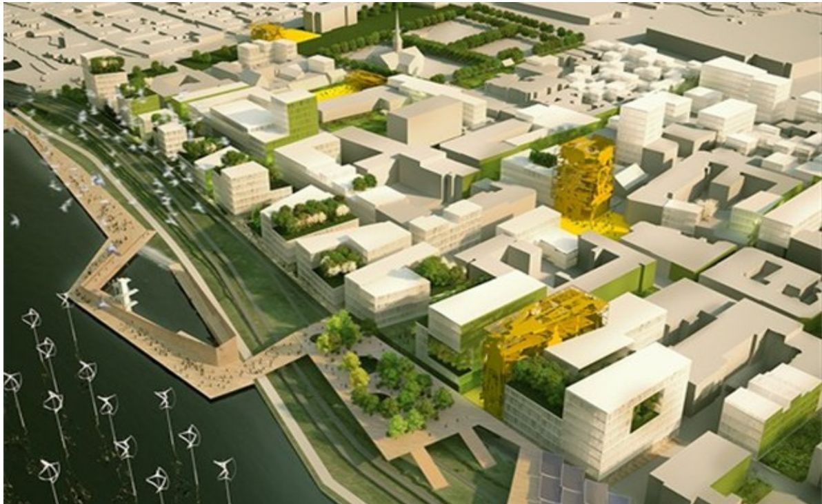
Bilde 2: Visualisering av fremtidens Strømsø. Bildet er laget av vinnergruppen av idékonkurransen, Norconsult og Alliance Arkitekter, og viser et bilde av hvordan Strømsø kan bli om deres strategier gjennomføres, med fortetting og nye grøntstrukturer (Drammen kommune 2010: 15).