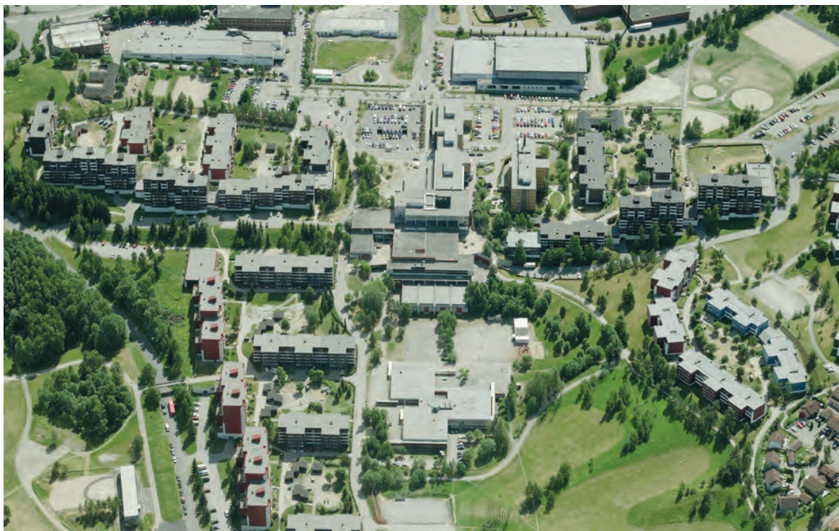
Bilde 3: Furuset sentrum. Fotografi av Furuset sentrum og den sentrale delen av konkurranseområdet, med Furuset senter og T-banestasjon sentralt i bildet, og borettslagene rundt. (FutureBuilt 2010: 2).

I tillegg til dette har Furuset store grøntarealer og et aktivt lokalmiljø, blant annet med utgangspunkt i idrettsforeningen Furuset Forum. Strømsø og Furuset skiller seg dermed fra hverandre på mange måter, men de har også klare likhetstrekk. Begge steder har en høy andel innvandrerbefolkning, og Furuset har på samme måte som Strømø fått mye negativ omtale i media de senere årene; særlig med fokus på kriminalitet og ungdomsbråk.