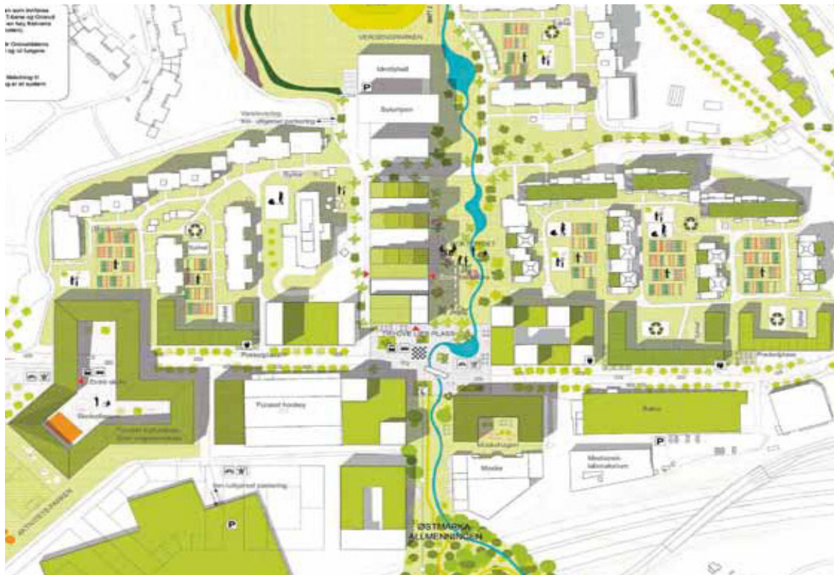
Bilde 4: Visualisering av fremtidens Furuset. Vinnergruppens bebyggelsesplan og fremtidsbilde av Furuset. Trygve Lies plass med T-banestasjon og Furuset senter sentralt i bildet. Visjonen om åpning av Senterbekken vises som en gjennomgående blå struktur fra Verdensparken til Østmarka (med lokk over E6) (Norske arkitektkonkurranser 2011: 4).