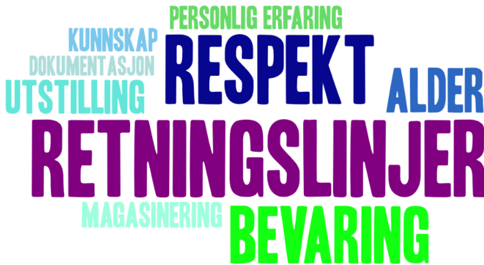
Figur 2 Ordsky basert på tematisk analyse av intervju.