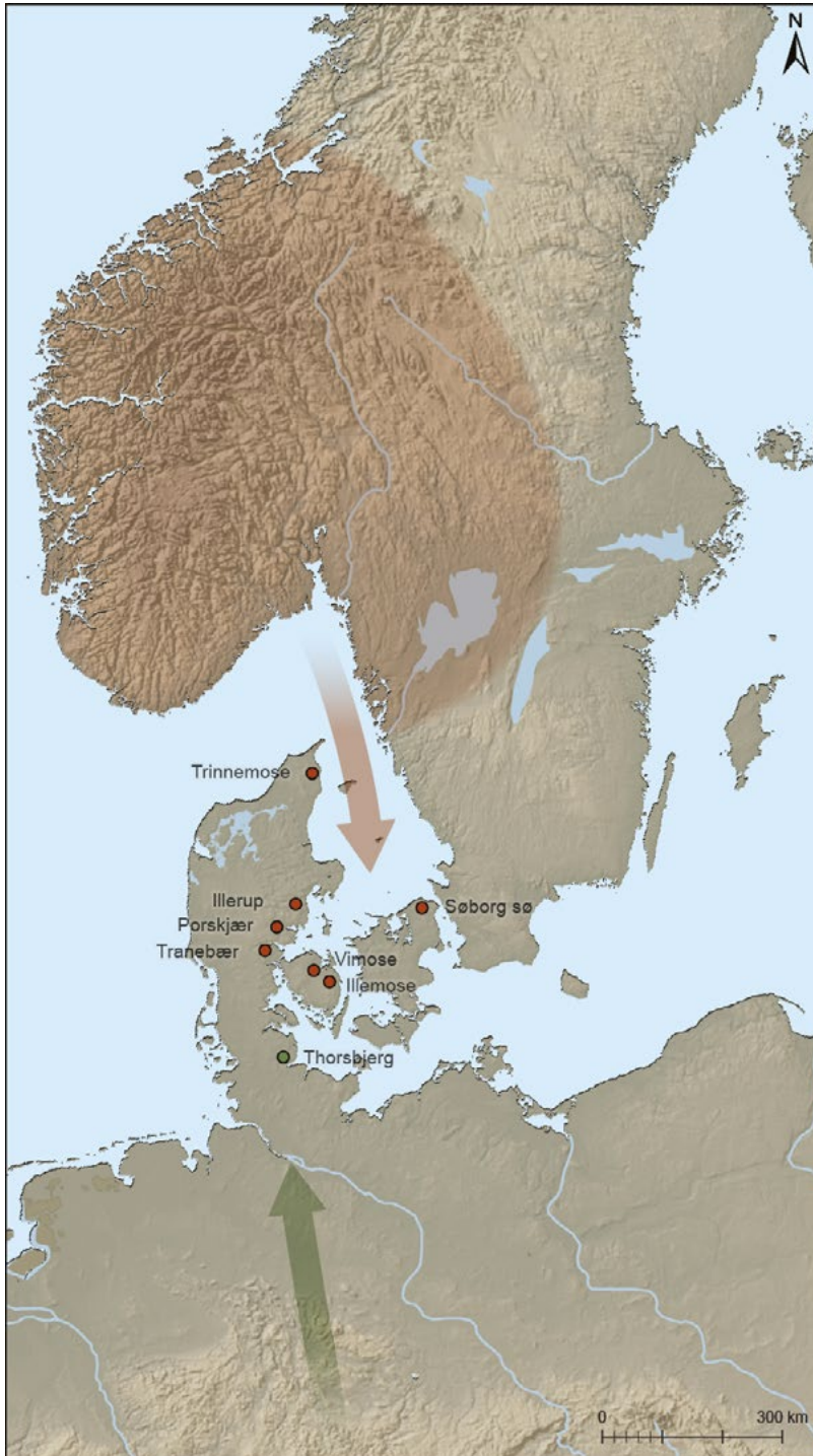
Figur 3. Fra større eller mindre deler av det rødmarkerte området kom flere av de hærene som ca. 200–250 ble beseiret på Jylland, Fyn og Sjælland, og som fikk sine våpen og utstyr ofret i sjøer der, markert med røde prikker. Illustrasjon: Ingvild Tinglum Bøckman (basert på Ilkjær 1994: fig. 2).