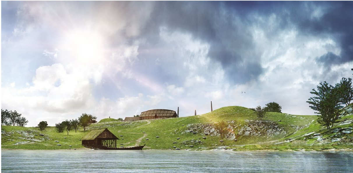
Figur 1. Slik kan Avaldsnes ha tatt seg ut fra sjøsiden omkring 300 e.Kr. Ovenfor naustet er hallen den mest synlige bygningen, og bakenfor til venstre skimtes sydden av langhuset. Ellers så de sjøreisende opp på de to gravhaugene Flaghaug (til høyre) og Kuhaugen (til venstre) og på de den gangen tre bautasteinene mellom hallen og Flaghaug. Bygninger og monumenter står det mer om i de ulike kapitlene i den første boken fra Kongsgårdprosjektet Avaldsnes (Skre 2017c). Illustrasjon: Arkikon.

til Romerrikets grenseområder langs Donau, vel 75 miles vandring fra Østersjøens sydkyst gjennom dagens Polen og Ukraina. I boken behandler jeg hele Skandinavia, men siden denne teksten publiseres i en bok fra Karmøyseminaret, legger jeg her mest vekt på de vestsandinaviske kystområdene.