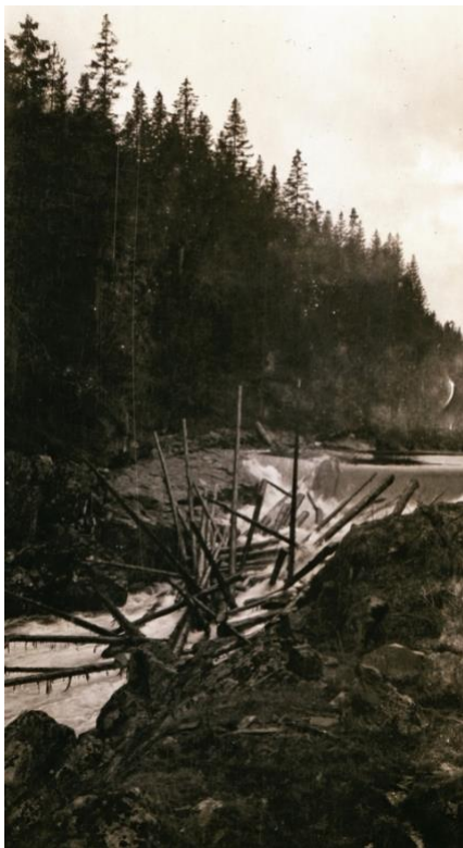
«Tømmervase i Fulldøla.»