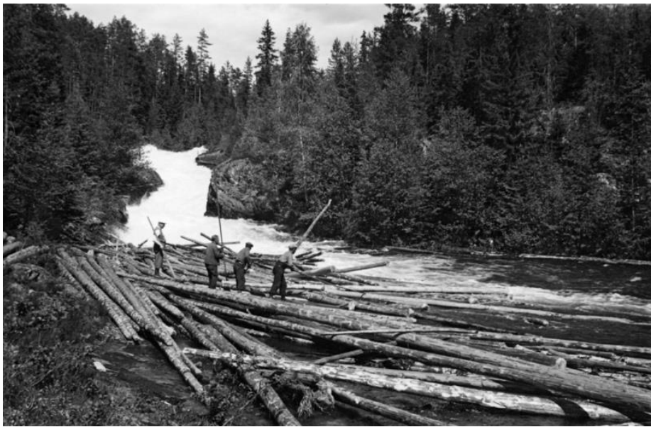
«Brøtning Fulldøla 16/6-38 Sagfos.»