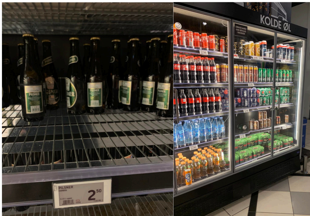
Figur 1: Bilde tatt i matbutikken Bilka i Ørestad , København. Til venstre bilde av en flaskeøl til 2,5kr. Til høyre bilde av «Kolde øl» ved siden av brus, etter første kasse før man går ut av butikken.

«våte» europeiske modellen - der en drikker til daglig. Danmark gir mye ansvar og frihet til