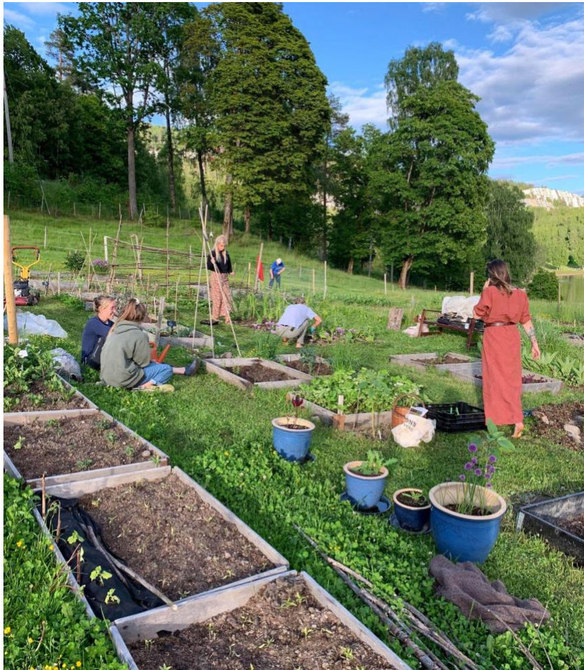
En sommerdag i parsellhagen.