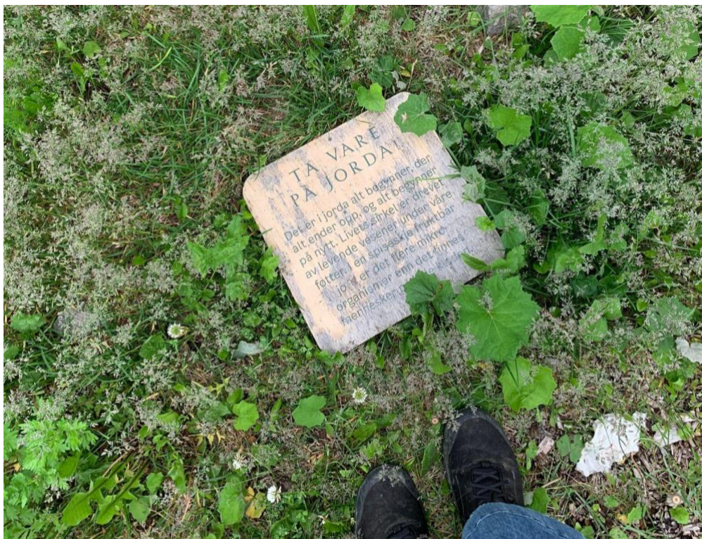
“Ta vare på Jorda”-skilt funnet på bakken i den urbane allmenningen.

Da jeg først startet feltarbeidet, refererte jeg til områdene jeg utforsket som ulike “felt”, senere som “de urbane hagene”. I dette kapitlet introduserer jeg leseren for hverdagslivet i de ulike hagene og hva som preger dem i perioden mellom april og august 2022. Gjennom kapitlet vil leseren bli introdusert for noen av mine samtalepartnere som jeg refererer til som “hagebrukere”, “frivillige” og “andelshavere” basert på hagens organisering og hvilken rolle menneskene selv identifiserte seg med. Jeg har valgt å presentere hagene kronologisk etter tidspunktet jeg først besøkte dem. Dette vil bidra til å understreke når i sesongen jeg oppholdt meg i hagen, hvor jeg oppholdt meg mest og hvor mange hagebrukere jeg hadde “tilgang” til i den gitte perioden. Hensikten med kapitlet er å gi leseren innblikk i hverdagslivet i de ulike hagene gjennom å presisere deres kvaliteter, likheter og ulikheter.