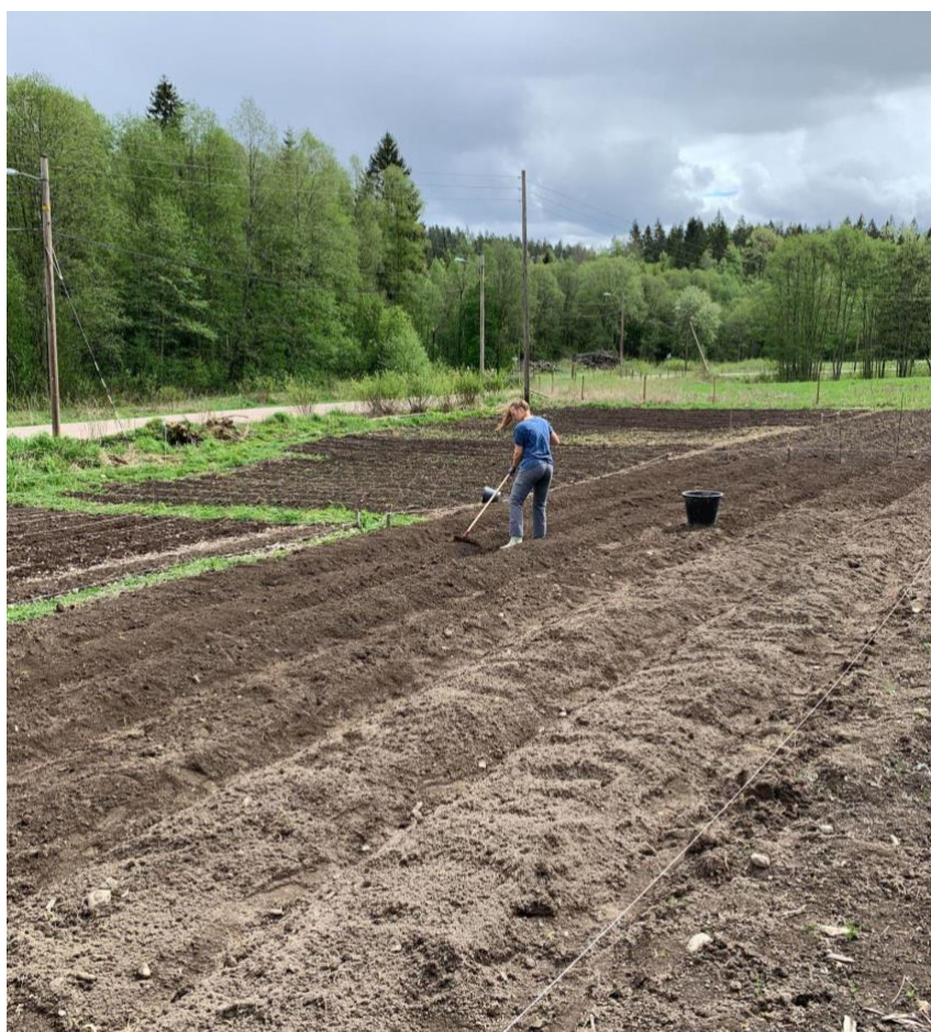
“Krafsing” av jorda før utplanting av vekster.