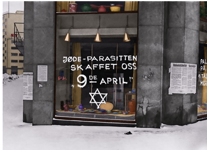
Foto: Anders Beer Wilse/Norsk Folkemuseum, fargelegging: Bendik B. Oddum