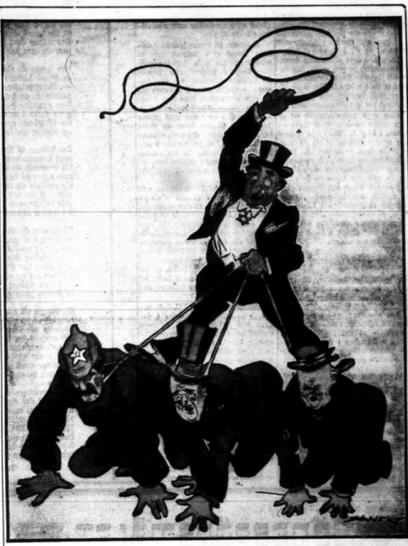
«FOR FOLKENES FRIHET.» Jøden: «Dere kan fremstille det som dere vil i deres taler og propaganda, men dette er min krig, som dere skal vinne for mig!»